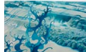
spring tide 2010 olie op doek 90x50 cm € 1250