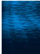
rollwaves 2 2009 digitaal fotowerk 60x50 cm € 550