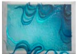
flow 2009 gemengde media 90x55 cm € 950