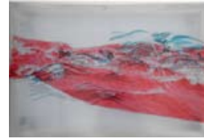
Waves from Severn Bridge 2009 gemengde media 90x55 cm € 950