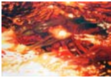
reflecting wave 2009 olie op doek 90x65 cm € 1250