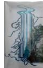
falls 2009 gemengde media 90x65 cm € 950