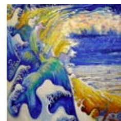
wave 2009 olie op doek 105x105 cm € 1450

De expositie Fluid Fascinations is te zien in de Faculteit Club van de Universiteit Twente tot eind april en is mogelijk gemaakt door Stichting Qua Art Qua Science.